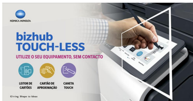
REDUÇÃO DE CONTACTO