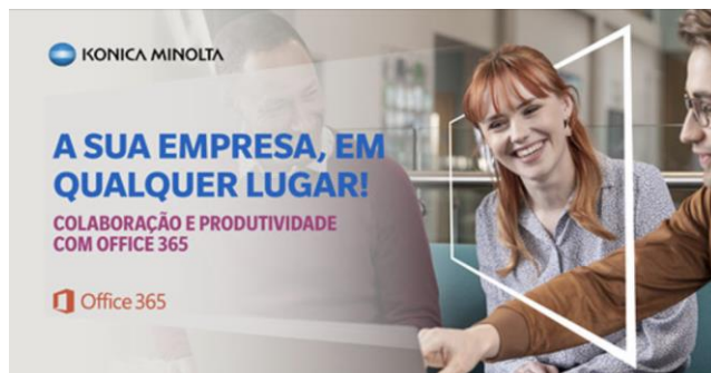
COLABORAÇÃO E PRODUTIVIDADE