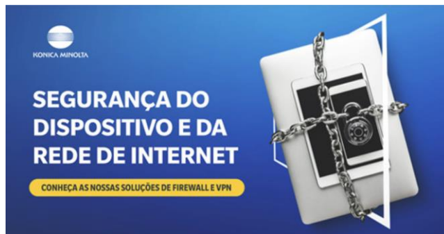
ACESSO REMOTO SEGURO